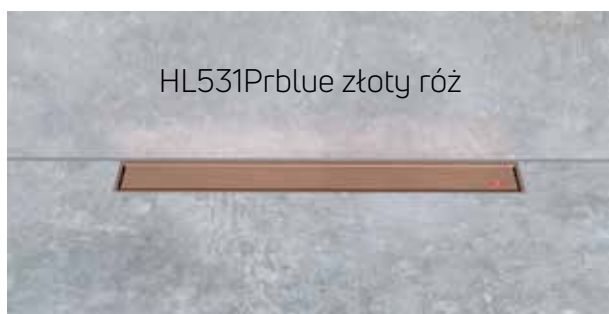
HL531Prblue złoty róż